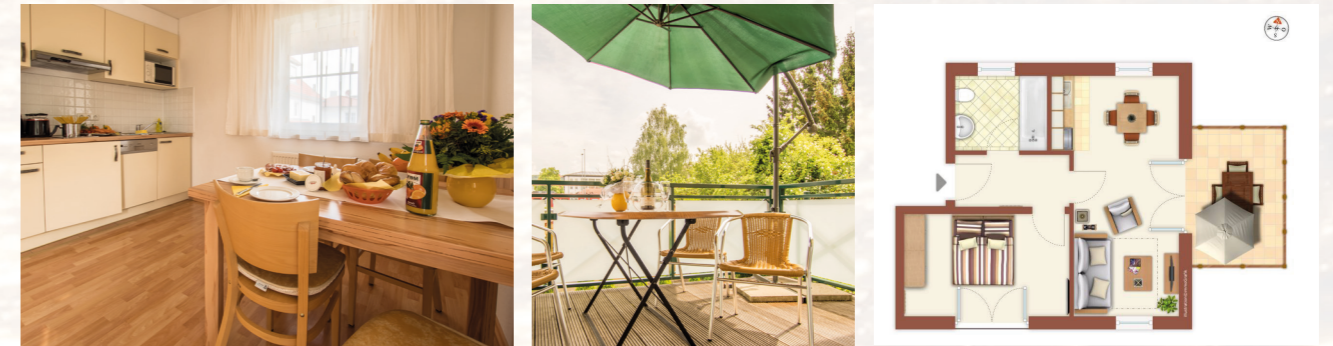
2-Zimmer-Apartment, ca. 48 qm Balkon ca. 10 qm 1. Obergeschoß (kein Aufzug)