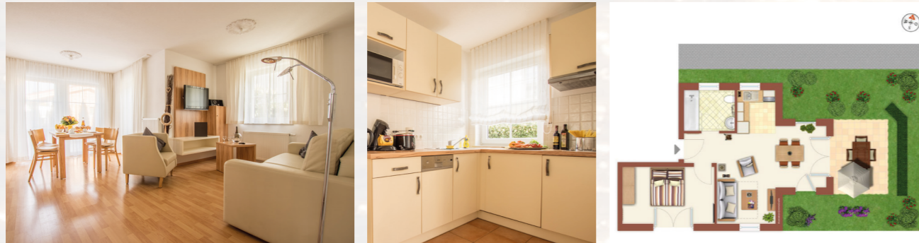
2-Zimmer-Apartment, ca. 55 qm Terrasse ca. 18 qm Barrierefrei