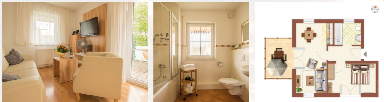
2-Zimmer-Apartment, ca. 48 qm Balkon ca. 10 qm 1. Obergeschoß (kein Aufzug)