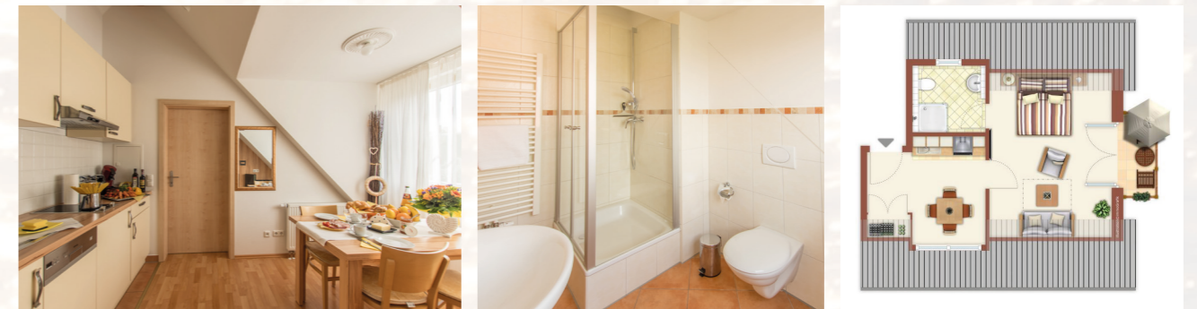
2-Zimmer-Apartment, ca. 35 qm Balkon ca. 3 qm 2. Obergeschoß (Mansarde, kein Aufzug)